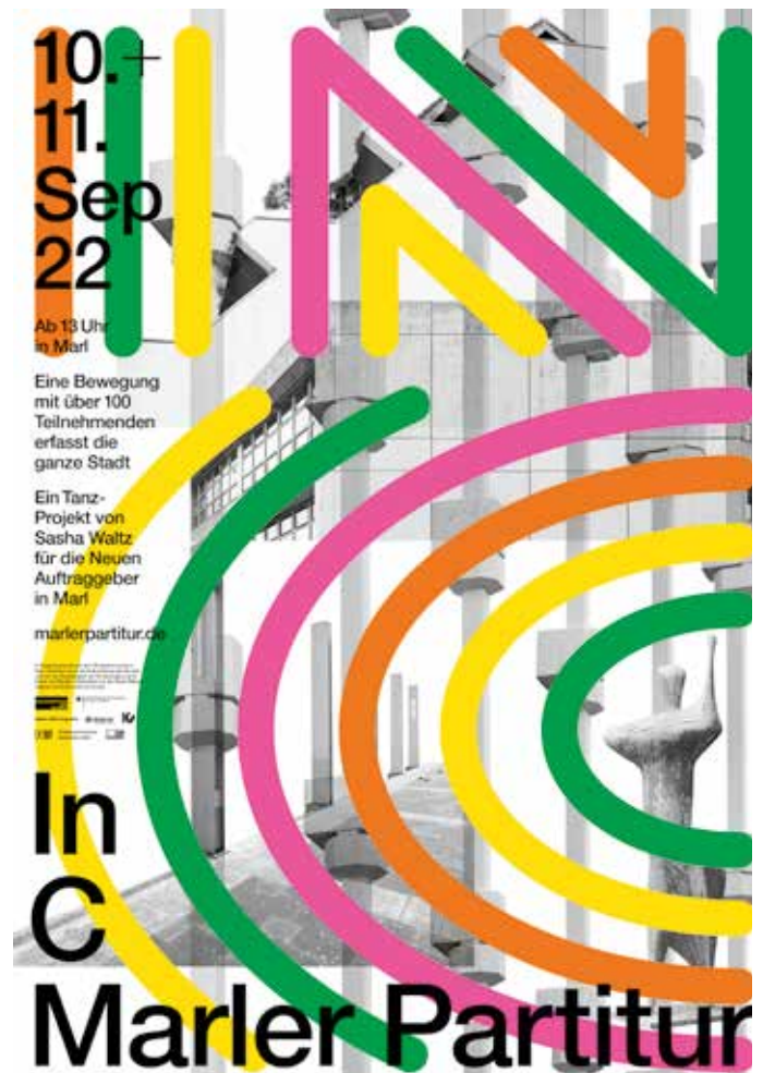
Plakat Marler Partitur. Die Stadt bewarb die Aufführung mit einer breit angelegten Plakatkampagne und begleitenden Programmflyern; Gestaltung: Daniel Wiesmann.

Am 11. September 2022 tanzten mehr als 100 Menschen „In C – Marler Partitur“. Diese gemeinsame Bewegung setzte eine große Energie