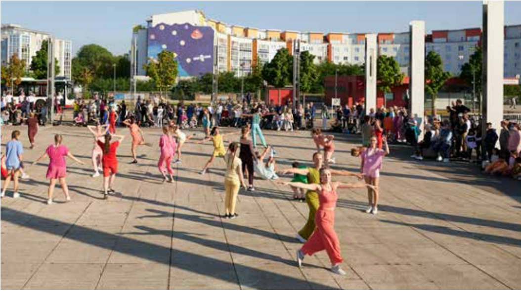
Aufführung In C – Marler Partitur; Foto: Florian Wagner.

läutenden Glocken machten sie andere auf sich aufmerksam. Manche schlossen sich an, bis zum Schluss oder auch nur für ein Stück des Weges. Sie alle wurden Teil der Bewegung, die an diesem Tag durch Marl ging; Foto: Florian Wagner.