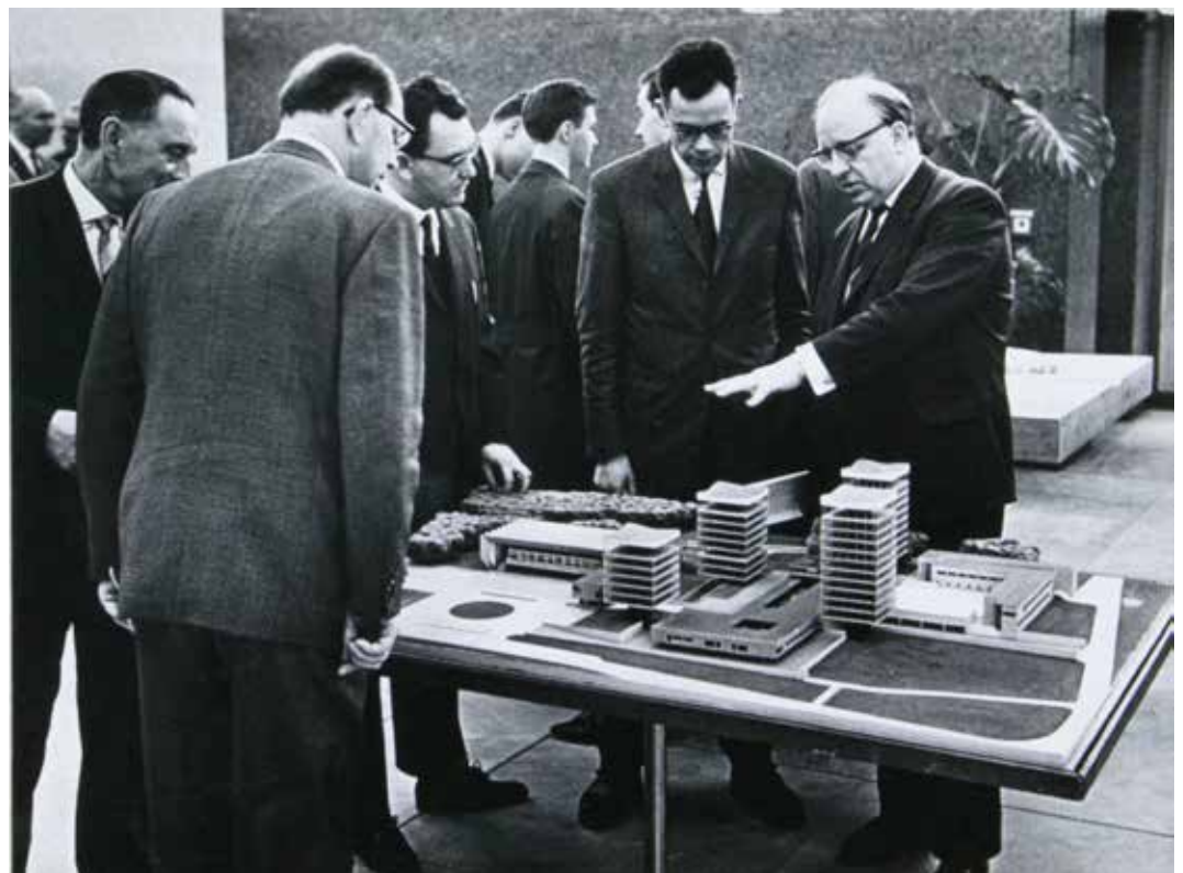
Marl: Bürgermeister Rudolf-Ernst Heiland erläutert einigen Stadtverordneten das Modell des Marler Rathauses, Februar 1956; Foto: Axel Carp / Fotoarchiv Ruhr Museum.